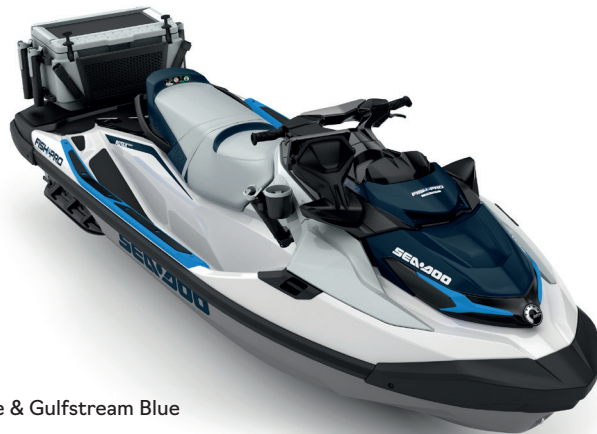
White & Gulfstream Blue