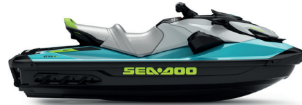
● Teal Blue and Manta Green