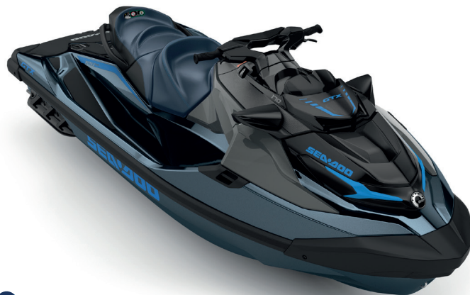
Blue Abyss / Gulfstream Blue